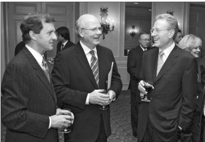
Just some of the celebrities attending the CFU International Statesmen Dinner — left to right: Hon. Allan Rock (then Minister of Industry), CBC News Anchor Peter Mansbridge, Senator Art Eggleton.

Гості та добродії, зліва направо: Теодосій Буйняк, дост. Марія Бунтроджанні, дост. Борис Тарасюк, мер Торонто Дейвид Миллер, Марґарета Шпір, Ерик Марґоліс, дост. Юлія Тимошенко, Юрій Даревич, Андрій Чорній, Надя та Євген Коструби.